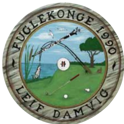
1990 Leif Damvig (1984) fabrikant, Taastrup golf, fiskeri, klarinet, firmalogo (Tove Romme)